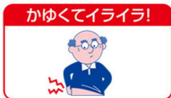
老人の乾燥性皮膚