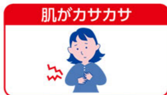
成人の乾燥性皮膚