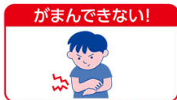
小児の乾燥性皮膚