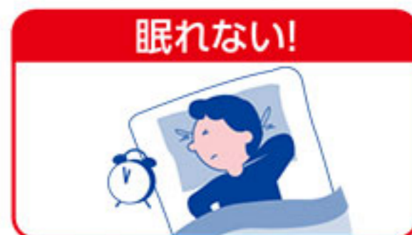
体が暖まるとかゆい! (→裏面に続きます。)