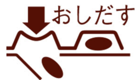
(PTPシートの取り出し図)

右図のように錠剤の入っているPTPシートの凸部を指先で強く押し、裏面のアルミ箔を破り、取り出してお飲みください。(誤ってそのまま飲み込んだりすると食道粘膜に突き刺さるなど思わぬ事故につながります。)